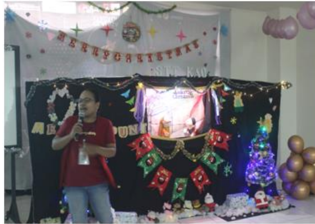
Gambar 5: Pelaksanaan panggung boneka di kelas kecil

Adapun naskah panggung boneka yang digunakan bertema “Hati yang Mengampuni” mengisahkan tentang seorang anak miskin yang awalnya tidak bisa mengampuni temannya yang suka jahil dan mengejeknya. Namun setelah mendengarkan cerita Firman Tuhan, akhirnya anak miskin ini mengerti bahwa hadiah terindah yang dapat diberikan pada Tuhan di hari Natal ini adalah Hati yang bersih dan mau mengampuni. Pada akhirnya anak miskin ini mau mengampuni temannya. Demikian juga temannya yang suka mengejeknya pada akhirnya mau minta maaf dan berjanji mau menjadi anak yang baik. Adapun naskah dari panggung boneka yang digunakan dalam pembekalan ini adalah sebagai berikut: