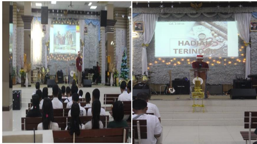
Gambar 3 & 4: Ceramah Interaktif yang dilakukan oleh Pengabdi