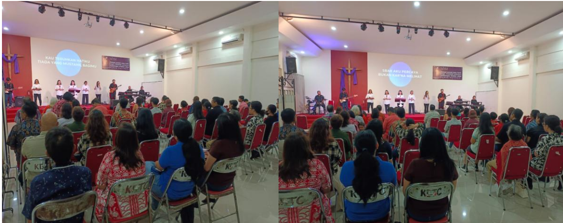
Gambar 1 & 2: Praise and Worship sebelum pelaksanaan Pendalaman Alkitab

terbangun, sebuah eksposisi mendetail akan dilakukan untuk menguraikan proses transformasi tersebut, mulai dari beban dosa yang menindas, kelegaan melalui pengakuan, sukacita pengampunan, hingga kehidupan baru dalam penjagaan Allah. Bagian ini akan diakhiri dengan umpan balik dari peserta untuk melihat bagaimana respon jemaat terhadap pendalaman Alkitab ini.