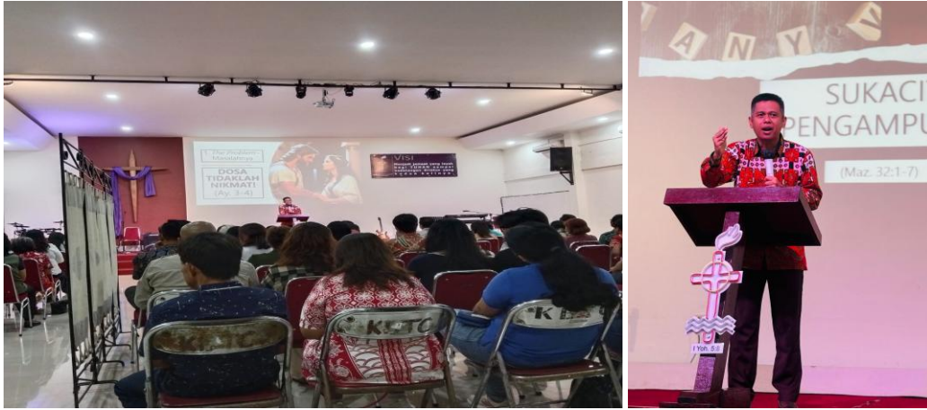
Gambar 3-5: Penyajian Pendalaman Alkitab oleh pengabd.

mereka dengan sukacita. Mazmur ini, yang dimulai dengan kebahagiaan individu, diakhiri dengan nyanyian komunitas, menggambarkan tujuan akhir dari pemulihan: reintegrasi ke dalam persekutuan umat Allah yang merayakan kasih karunia-Nya (Botha, 2019).