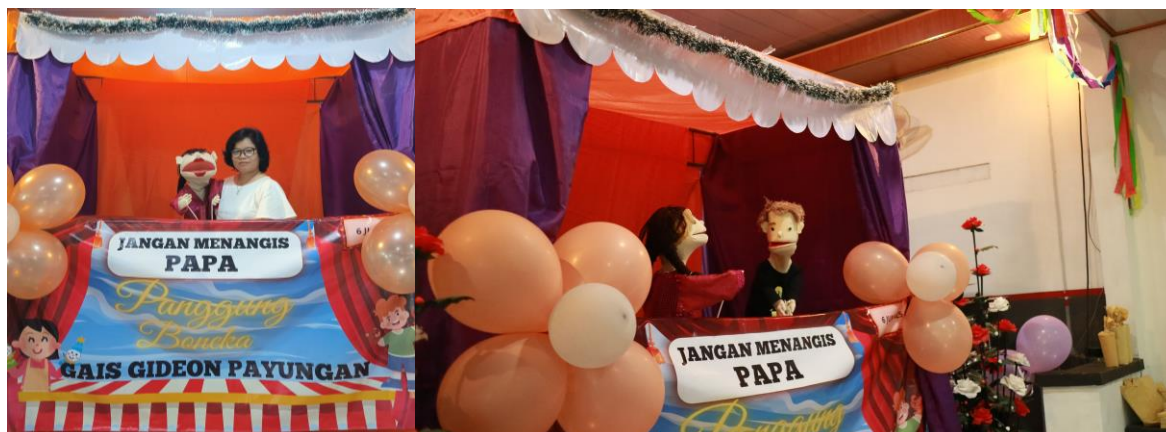
Gambar 1. Pelaksanaan PkM Melalui Panggung Boneka