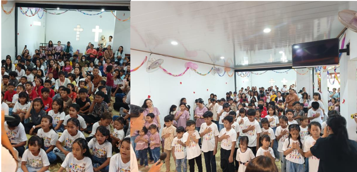
Gambar 2. Anak-anak Peserta Pengabdian kepada Masyarakat

Dengan keterhubungan narasi cerita yang dekat dengan realitas sosial anak, media ini memungkinkan peserta mengalami proses pembelajaran yang kontekstual dan bermakna. Selain itu, keterlibatan gereja sebagai fasilitator pembinaan membuktikan bahwa kegiatan ini tidak hanya berorientasi pada edukasi satu arah, tetapi juga memperkuat kolaborasi gereja–keluarga sebagai ruang pertumbuhan spiritual anak yang berkelanjutan.