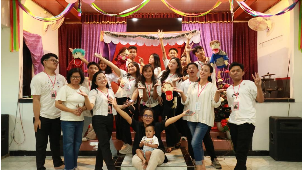
Gambar 3. Foto Bersama Panitia dan Pelaksana Pengabdian kepada Masyarakat